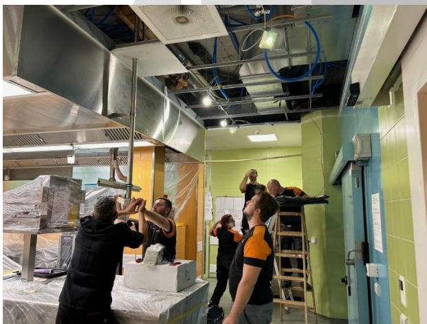
Abdecken der Küchengeräte

Wegen dem Umbau ist das Café Momo bis zum 11. August geschlossen, damit die kalte Küche dort bereitgestellt werden kann. Die warme Küche wird in der Halle 7 beim Restaurant Blinde Kuh hergestellt. Um einen reibungslosen Ablauf zu gewährleisten braucht es das Hand-in-Hand-Anpacken aller Beteiligten. Die Pflege hilft beim Essensservice aus, die Abwaschmannschaft trägt das Geschirr hin und her, der Hausdienst springt wie immer ein wo es sie braucht.