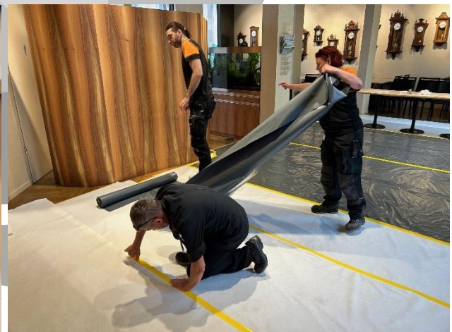
Abdeckung des Bodens im Café

Am 7. August wird die Küche wieder zurück ins Momo gezügelt und am 12. August wird das Café Momo wieder für seine Besucher geöffnet.